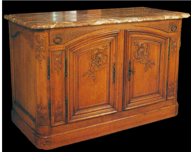
Buffet de chasse

C'est un buffet bas couvert d'un marbre épais ou d'une pierre possédant deux tiroirs à couteaux et qui s'ouvre par des portes à double révolution. Il meublait un pavillon de chasse.