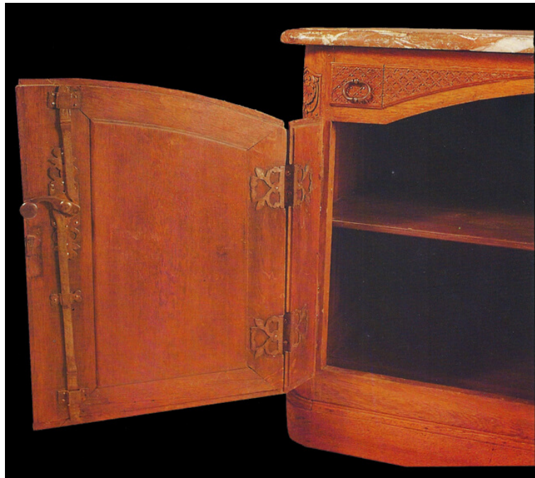
Porte gauche du buffet